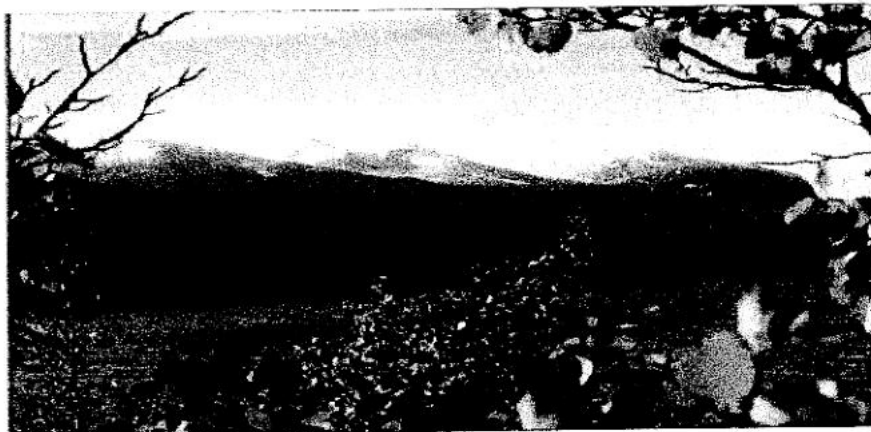
Galleri Alm presenterar fjällen rakt söder om Abisko.

På annan plats i bullen publicerar vi hela artikeln om Radio Cora. Ursprungligen var historien om Radio Cora publicerad i Distance 9/90 (tnx HK)