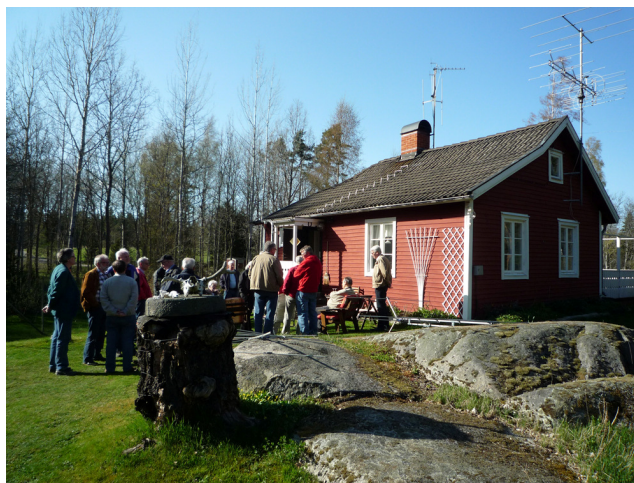
Samling vid Hasses chateau i det fina vädret – i väntan på förfriskningar! (Ur FD:s album)