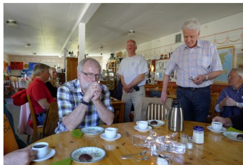
En fundersam TN vid fikat innan allvaret började.

Sen kom ju kvällens clou! SILLAMACKAN som värdskapet dvs BE HM bjöd på helt ur egen ficka!! Lustigt nog fanns det lite dricka över från förfriskningarna på Johansberg! Heja!