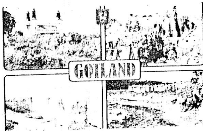
Aqui, um cartão postal de Gotland, Suécia, que Bjorn mandou na carta que chegou ontem à Clube.