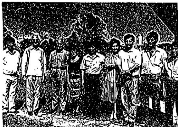
El personal completo