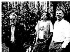
Vad tittar dessa gossar på