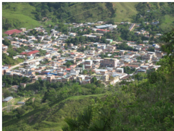
Centralorten Rioblanco i kommunen Rioblanco har bara 5000 invånare. Bilden kommer från kommunens hemsida.