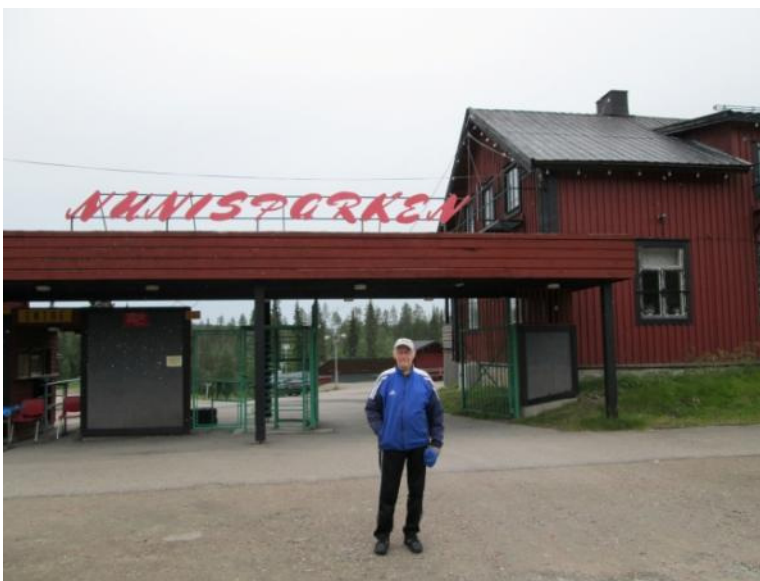
AH vid Nunisvaara