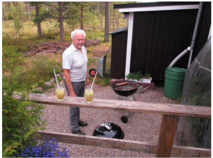
JE vid grillen