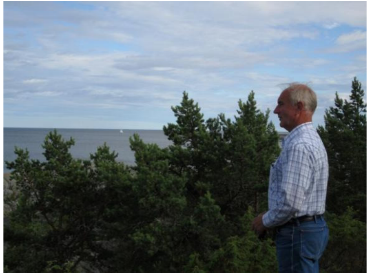
SW vid Åstön