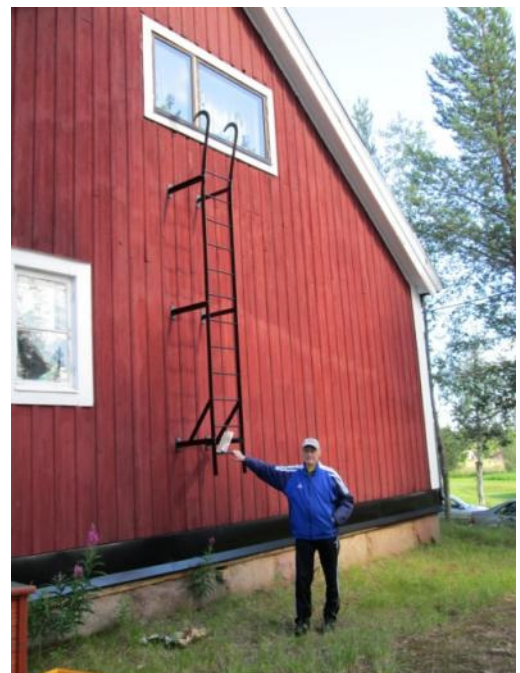
AH vid Purnuvaara