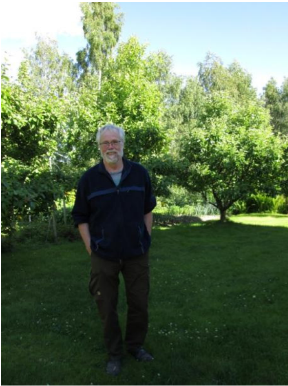
GN vid sin prunkande trädgård