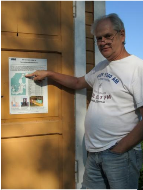
BOS vid en SMHI station