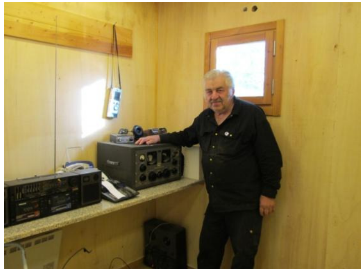
YM vid sin SP600