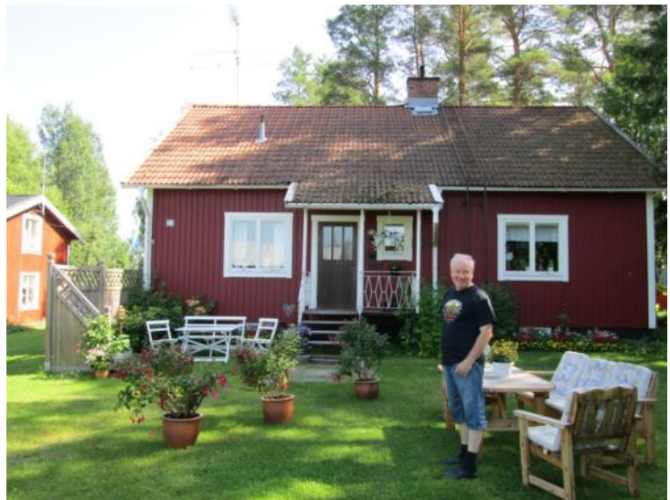
LAB vid sitt QTH