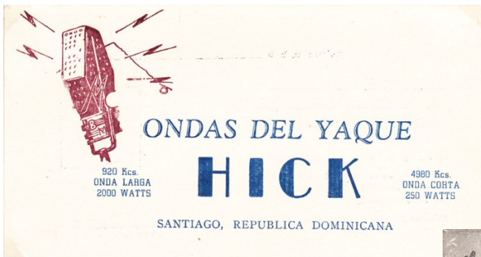
Ondas del Yaque från 1962