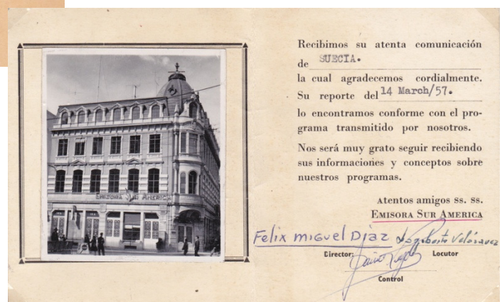
Emisora Sur America från 1957