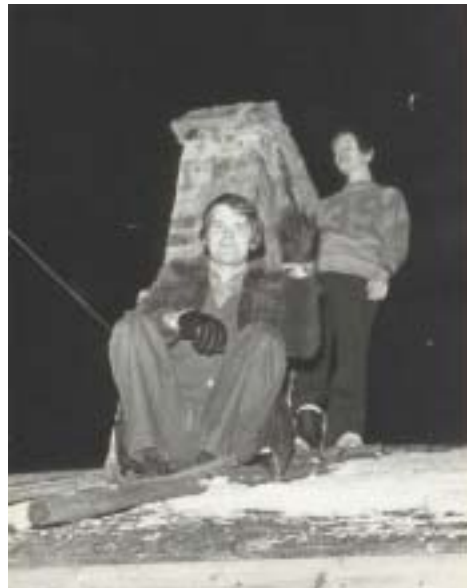
TM Kumpulän kerhotalon katolla.