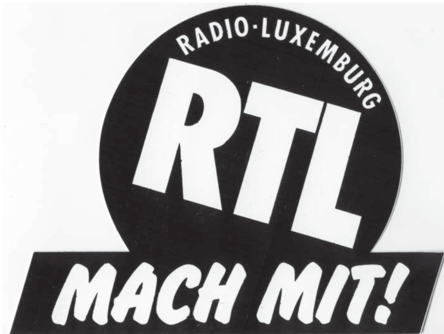
Luxyn tarra 1980-luvulta löytyy monen dixarin kansista