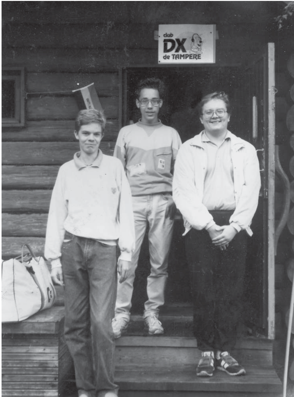
TreDXKin ns. edustustiimi eli noviisit RHI, JKZ ja jo hieman kokeneempi RKO tamperelaisten mökin edustallavarsin legendaarisessa Pieksämäen Partaharjun kesäkokouksessa elokuussa 1989.

Monien Kumpula- ja UKI-aamujen sato oli enimmäkseen britti- ja lattarisuunnit-